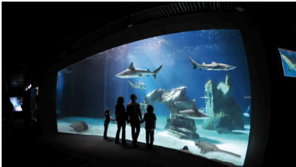
Una famiglia davanti ad una vasca che ospita gli squali

Sabato alle 16 nella sede del club in via Fratelli Garrone, ospite la versione italiana della Shark School